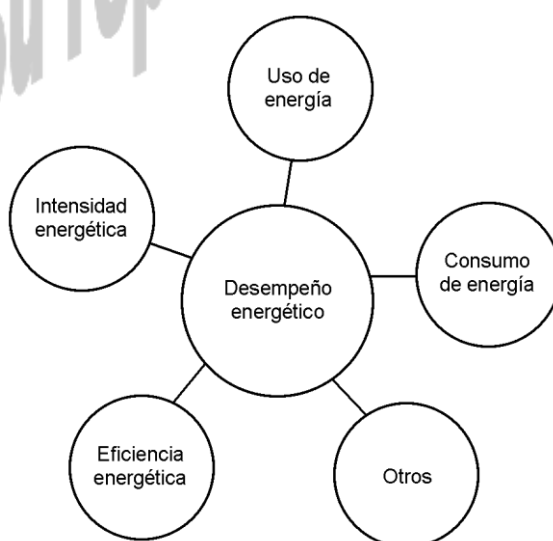
Figura A.1 — Representación conceptual del desempeño energético

La Figura A.1 ilustra una representación del concepto de desempeño energético.